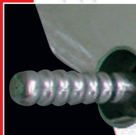
Hörnchenformer mit Dorn